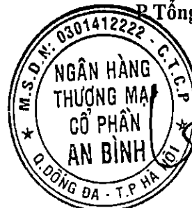
Đỗ Lam Điền